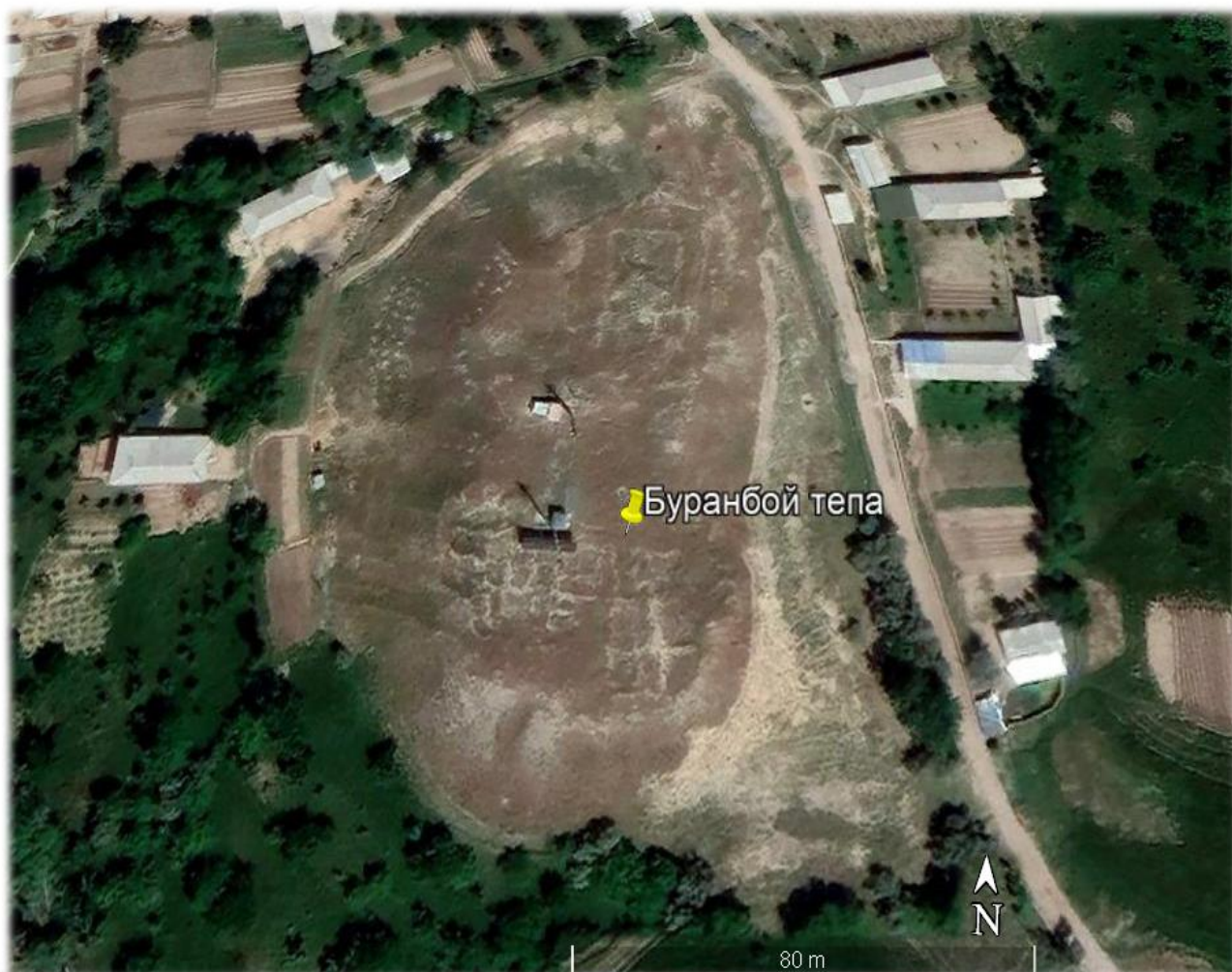
Рис. 1. Поселение Буранбой (вид сверху).